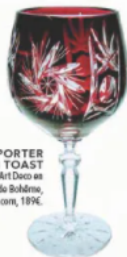
POUR PORTER UN TOAST Verre à vin Art Deco en cristal de Bohême, cristalartdeco.com , 189€.