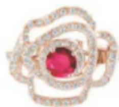
POUR UNE DEMANDE OFFICIELLE Prima Rosa, bague en or rose, diamants et rubis, Gemrayo, 5425€.