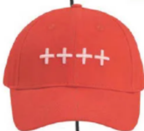
POUR ELLE ET LUI Casquette de baseball rouge, Essentiel Antwerp, 55€.