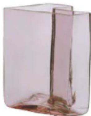
POUR UNE BRASSÉE DE ROSES Vases géométriques en verre Karismatik, Ikea, 19,99€ la paire.