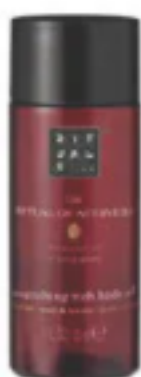
POUR UN MASSAGE EN DUO Huile corps riche The Ritual of Ayurveda , Rituals, 19,50€.