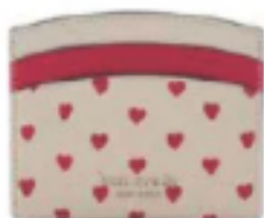
POUR RANGER SES PETITS MOTS Porto-cartes imprimé de cœurs, Kate Spade, 54,95€.