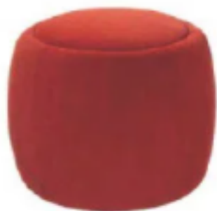
POUR SOUPIRER Tonno, pouf velours, Royal Botania, 599€.