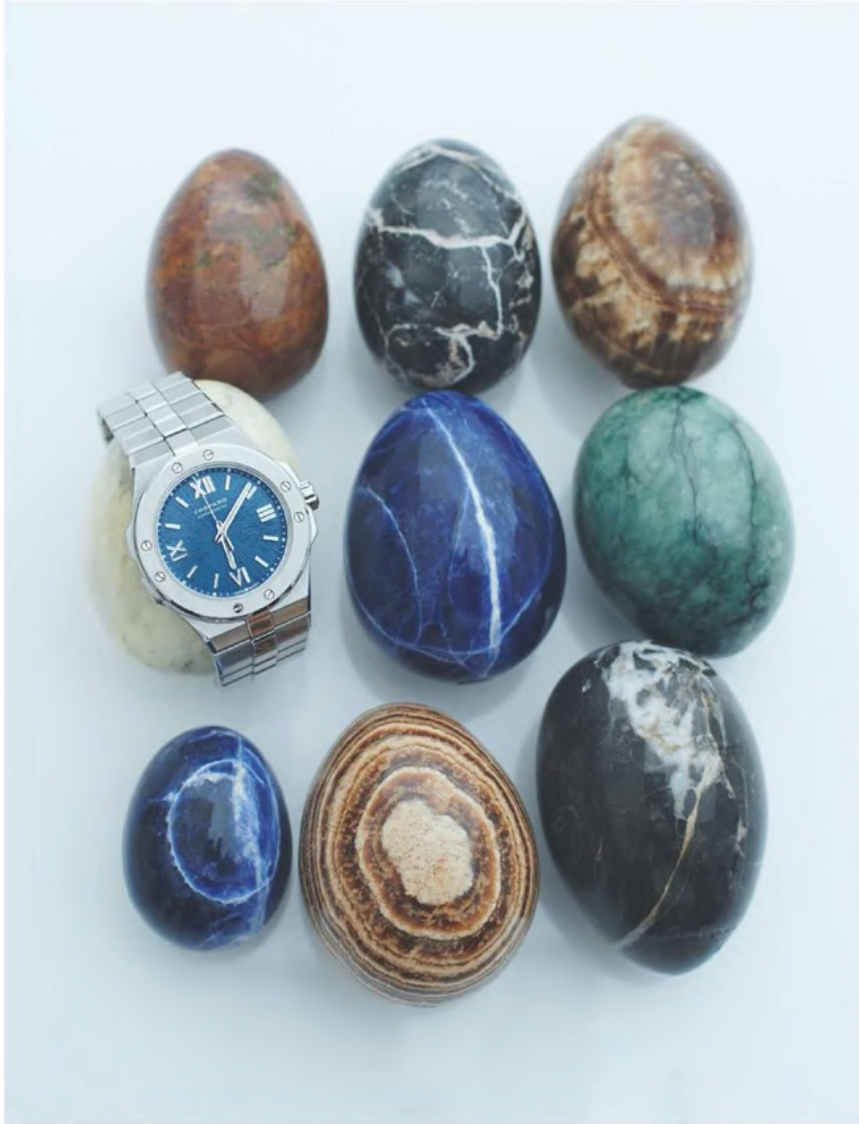
Montre Alpine Eagle 36 en acier inoxydable Chopard. Page opposée : monoboucle d'oreille et bague Possession en or blanc serti de diamants et de saphirs Piaget. Gilet en cuir Hermès.