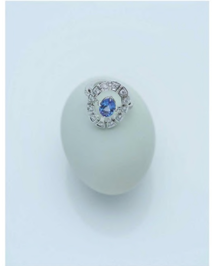
Bague Frame en or blanc serti de diamants et de tanzanite Rouvenat. Paire opposée: bagues Baby EverBloom en or blanc serti de diamants et de saphirs Gemmyo. Robe en laine et coton Dior.

Mannequin: Marie Agnes (The Claw Paris). Maquillage: Kamila Vay. Coiffure: Gilles Degivry. Manucure: Virginie Mataja. Assistante styliste: Léa Grandi. Production: CallTime