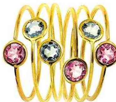
BAGUES "MOANA" EN OR ET TOURMALINE OU AIGUE-MARINE, GEMMYO.

Cette pierre se présente sous une multitude de couleurs, rose, rouge, jaune, brun, vert, bleu, violet, noir. Les tourmalines d'une seule teinte sont rares, la plupart offrant un dégradé de couleurs contrastées. Les tourmalines roses, rouges et vertes sont les plus prisées. La noire aussi, on l'appelle alors Schorl. Ses propriétés électriques ont fait l'objet de nombreuses expériences. Elle fut baptisée la pierre de sérénité, de sagesse, de quiétude. On dit aussi qu'elle met les pieds sur terre et que c'est donc la pierre de l'enracinement. En lithothérapie (soin par le pouvoir des pierres), elle réduirait les vertiges et régulerait la tension artérielle et les hormones. Elle adoucirait les nerfs et aiderait à la concentration. La tourmaline a un pouvoir de protection, offrant courage et confiance. Elle attire l'amitié et la prospérité, stimule l'inspiration et incite à la tolérance.