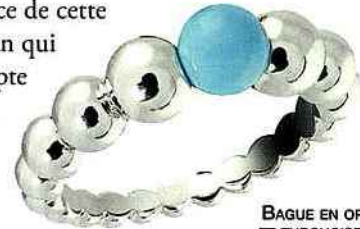
BAGUE EN OR ET TURQUOISE, VANCLEEF & ARPELS.

Elle a pris son nom au moment des Croisades. À cette époque, le commerce de cette pierre traversait la Turquie, on l'a donc nommée Pierre Turque... C'est l'Iran qui est aujourd'hui le plus grand producteur de turquoise. On trouve aussi en Égypte une turquoise plus verte. La turquoise dite orientale est d'un bleu-vert dur opaque. Elle tient sa couleur du cuivre qu'elle contient. Cette pierre fine est sacrée par plusieurs civilisations : chez les Incas, les Mayas et les Aztèques, mais aussi au Tibet, en Égypte et en Iran. Elle est le symbole du courage, de la générosité, de l'indulgence, de la paix, de la sagesse. On pense aussi que la turquoise éloigne les cauchemars et qu'inversement si l'on rêve de turquoise c'est un signe de chance et de fortune... Enfin, on a dit d'elle qu'elle protégeait des chutes et des accidents, les cavaliers en ont donc fait leur pierre porte-bonheur.