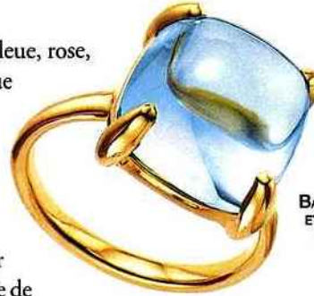
BAGUE EN OR ROSE ET TOPAZE BLEUE, TIFFANY & Co.

Cette pierre peut avoir différentes couleurs, toujours pâles : bleue, rose, jaune, verte, dorée, orangée... La bleue est semblable à l'aigue marine, la jaune est la plus répandue, la rose la plus précieuse. Ce minéral est connu depuis le Moyen Âge pour fortifier les défenses du corps contre le rhume et la grippe. Il détendrait aussi les nerfs, agirait sur les varices et les thromboses et enfin neutraliserait les liquides empoisonnés. Pour les Égyptiens, la topaze représentait Ra, le dieu du soleil, donateur de vie et de fertilité. On l'appelle aussi la Pierre sainte, symbole de fidélité et de puissance. La topaze jaune est, elle, associée à la jeunesse et à la force. Elle évoque aussi l'amitié, la chance et la générosité, la foi et la sagesse, la droiture et la loyauté. Elle tempère les empressés, calme les gens trop sensibles et chasse tristesse et mélancolie.