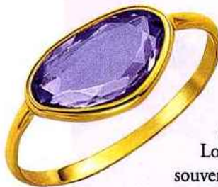
BAGUE EN OR JAUNE ET AMÉTHYSTE, LE MANÈGE À BIJOUX.

C'est la plus précieuse des pierres de la famille des quartz, aux teintes violettes, mauves, roses, diaphanes à translucides. Son nom vient du grec et signifierait "non ivre", il lui viendrait de sa couleur de vin coupé d'eau. Par extension, on disait de cette pierre qu'elle protégeait de l'ivresse et donc favorisait la clarté intellectuelle. Lorsqu'elle est chauffée à 500 °C, elle devient jaune, on lui fait donc souvent subir ce traitement thermique pour obtenir une citrine.