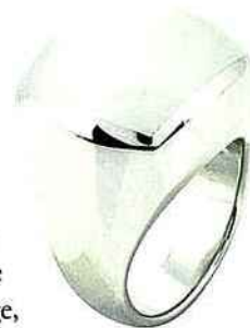
BAGUE EN AGATE BLANCHE, ARTHUS-BERTRAND.

L'agate est une variété de calcédoine qui appartient à la famille des quartz. Cette pierre fine est d'origine volcanique et peut prendre différentes couleurs, blanche, rose, verte, jaune, bleue, beige, marron, noire... D'où autant de variétés d'agate! Depuis la nuit des temps, l'agate est connue pour ce qu'elle inspire aux hommes. Ainsi, pour les Grecs et les Romains, elle était symbole de force, de bravoure, de prospérité et de joie. On dit aussi que l'agate représente à la fois le courage, l'équilibre et l'apaisement, la confiance en soi, le partage, l'ouverture, le respect. Dans certaines croyances, on la voyait comme une pierre protectrice contre la sorcellerie et la foudre! Enfin, à la campagne, on pouvait enterrer une agate dans un champ afin de rendre la terre fertile et les récoltes abondantes et bonnes. Quoi qu'il en soit, l'agate est très recherchée en joaillerie.