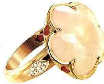
BAGUE EN OR, DIAMANTS ET QUARTZ ROSE, PASQUALE BRUNI.

Symbole d'apaisement et de sécurité, il supprime les angoisses, les dépressions, l'insomnie, on l'utilise donc pour soigner les traumatismes émotionnels graves. Il est aussi connu pour développer l'empathie, l'altruisme, la sensibilité, donc l'ouverture aux autres. Il serait efficace contre les blessures de la peau, les gerçures, les brûlures... Il permettrait de faire baisser la tension artérielle et serait bénéfique pour la circulation sanguine.