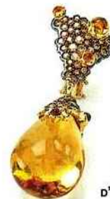
BOUCLES D'OREILLES EN CITRINE ET DIAMANTS BRUNS, ROBERTO COIN.