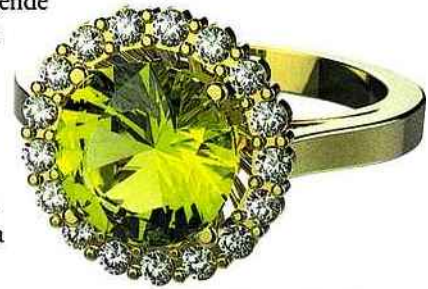
BAGUES "GAIA" EN OR, DIAMANTS ET PÉRIDOT OU GRENAT, GEMMYO

On l'appelle aussi olivine quand il est très foncé (vert olive) et chrysolite quand il est plus clair (jaune-vert). On raconte qu'il ne faut pas l'associer à une autre pierre fine, il perdrait alors ses propriétés. Le péridot se porte seul. Sa légende veut qu'il soit l'emblème du lion dans la tradition anglo-saxonne. Au Moyen Âge, il ornait les objets de culte et le mobilier ecclésiastique. Le trésor des Rois Mages de la cathédrale de Cologne contient des péridots. Il pourrait réduire les problèmes de peau, comme l'acné, et être très bénéfique pour l'estomac en désintoxiquant le système digestif. Cette pierre serait celle du milieu médical. On dit qu'il chasse la mélancolie, la tristesse et autres idées noires. Enfin, le péridot atténue la rancune et la jalousie.