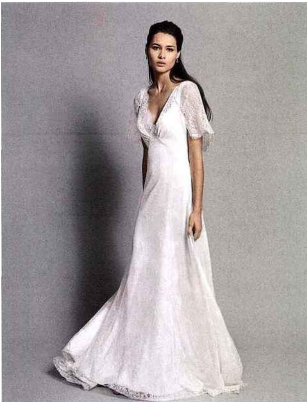
CRÉATION CHRISTOPHE ALEXANDRE DOCQUIN